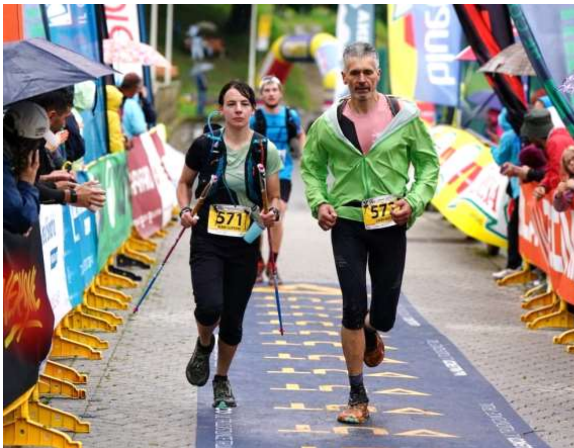
Foto: Klára Slepíková a Luděk Kučera - Valmalenco Ultra Distance Trail 2025

Děkuji pořadatelům Běžce Vysočiny za náročné dlouholeté pořádání závodů, jímž změnili myšlení i návyky stovek jejich účastníků.