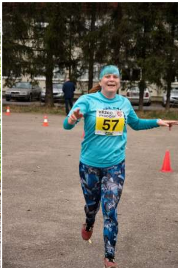
11.4.2025 2017, Jarní běh Pávov

Během těch devíti let jsem postupně vyzkoušela všechny tratě Poháru Běžce Vysočiny, některé pouze jednou nebo dvakrát. Zaběhla jsem si i závody, které jsou již zrušené nebo se do Poháru Běžce Vysočiny nezapočítávají: Pelhřimovský běh, Borovinská 10 a běh v Okříškách.