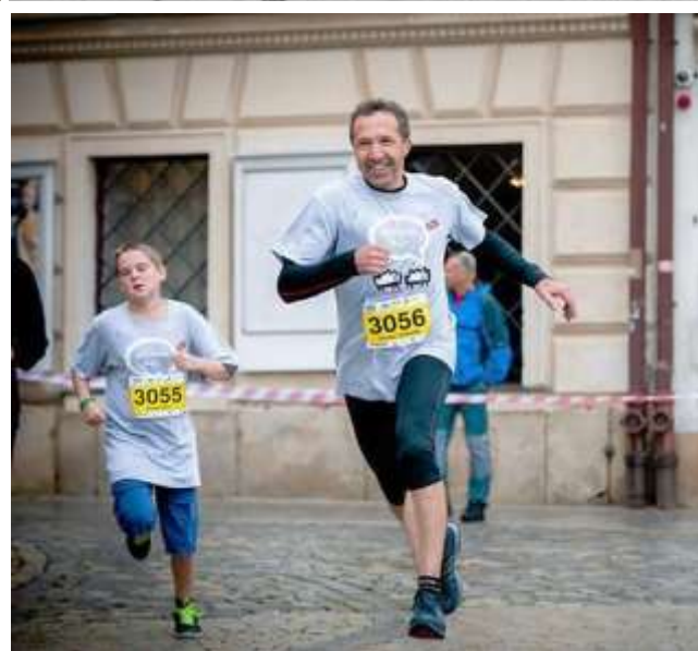
Vpravo: 2014, Jihlavský půlmaraton, rodinný běh