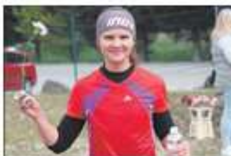
OLŠANY Běh jako výzva pro všechny, ne jen pro „elitní“ běžce. Mladý Vysočina 40 (11. ročník) má rekordy v 10 km (18:00) a 15 km (27:00).

A vítězka jedné, druhé kategorie v přípravě kategorie 10 km. Mladý Vysočina 40 (11. ročník) má rekordy v 10 km (18:00) a 15 km (27:00).