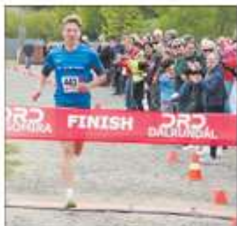
OLŠANY Běh jako výzva pro všechny, ne jen pro „elitní“ běžce. Mladý Vysočina 40 (11. ročník) má rekordy v 10 km (18:00) a 15 km (27:00).