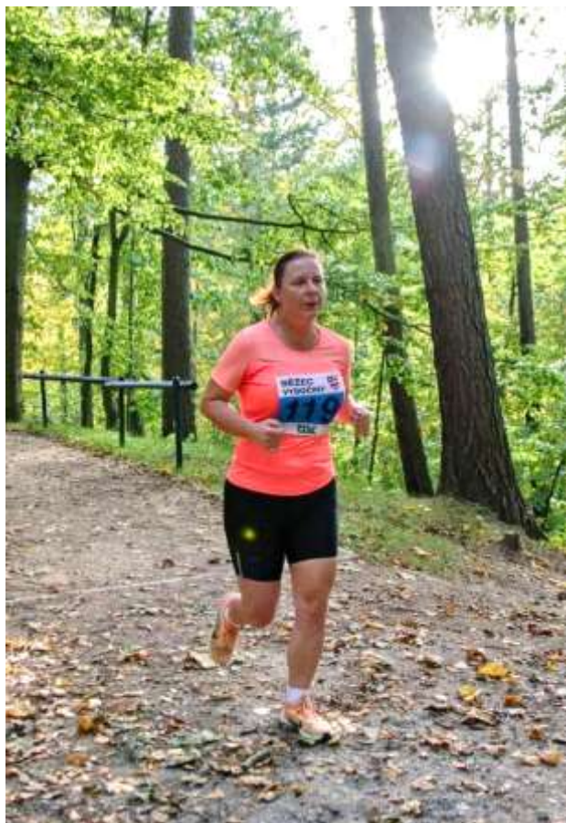
13.10.2023 Memoriál Jiřího Šmrhy, Heulos

První závod v Poháru Běžce Vysočiny byl pro mě v roce 2017 Jarní běh Pávov a od té doby jsem tento „otvírák sezóny“ nevynechala a zúčastnila se ho devětkrát. Další stálíci v mém běžeckém kalendáři je Cena Běžce Vysočiny, kterou jsem absolvovala osmkrát – i zde platí, že v roce 2000 byl závod zrušen. Sedmkrát jsem se postavila na start závodu ve Stonařově, Opatově, Polné a běhu Okolo Rudného.