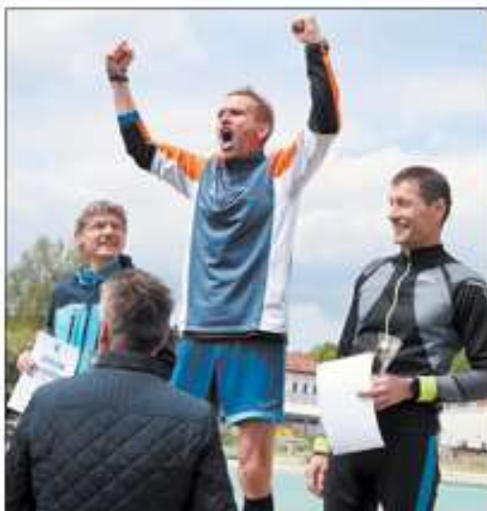
OLŠANY Běh jako výzva pro všechny, ne jen pro „elitní“ běžce. Mladý Vysočina 40 (11. ročník) má rekordy v 10 km (18:00) a 15 km (27:00).

A vítězka jedné, druhé kategorie v přípravě kategorie 10 km.