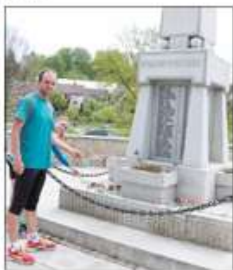
OLŠANY Běh jako výzva pro všechny, ne jen pro „elitní“ běžce. Mladý Vysočina 40 (11. ročník) má rekordy v 10 km (18:00) a 15 km (27:00).